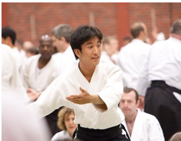
Der Sohn des amtierenden Doshu und Urenkel von O-Sensei: Waka-Sensei Mitsuteru Ueshiba

Verband ist denn nun „at the cutting edge“, sozusagen „in der Spitzenposition“? Wir brauchen offensichtlich Rangfolgen oder Hierarchien, um uns selbst einordnen zu können. Da können Dangrade schon ganz hilfreich sein ..., nur was machen wir, wenn die Graduierungen von unterschiedlichen „Autoritäten“ vorgenommen wurden oder vielleicht auch unterschiedlich teuer waren? Ganz vertrackt wird die Situation, wenn eine vermeintliche Autorität keine Graduierung führt und trotzdem in der Hierarchie oben mitmischt. Einer solchen Person wird scheinbar Respekt gezollt, aber sie steht mitten im Kreuzfeuer der offenen oder weniger offenen Kritik. Diese Rolle auszufüllen, ist bestimmt nicht leicht.