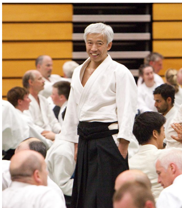
Doshu Moriteru Ueshiba

Auch sein Vater, der amtierende Doshu, machte auf mich im Training einen offenen Eindruck. Leider wird er durch das Hoffieren vor und nach dem Training so stark von den Menschen „abgeschirmt“, dass man glauben könnte, es gehe bei seiner Person um mehr als das Aikido. Dies war schon damals bei den World Games in Mühlheim an der Ruhr so, wo ich das erste Mal bei ihm trainieren konnte, und es war auch an diesem Wochenende in England ähnlich. Es scheint also weder ein typisch deutsches noch typisch englisches Phänomen zu sein. Eigentlich schade, denn ohne die nötige Etikette aufzugeben, könnte ich mir vorstellen, dass allen ein offenerer Kontakt oder besser eine offenere Einstellung gut tun würde. Ich mag da falsch liegen, aber ich habe den starken Eindruck gewonnen, dass Waka-sensei sehr darum bemüht ist, und ich hoffe sehr, dass man ihm den Weg dafür nicht durch falsch verstandene Höflichkeit verbaut. Mehr aber befürchte ich, dass man ihm, wie auch schon seinem Vater, die offene und bescheidene Art als Schwäche auslegt und damit wieder in den Teufelskreis des Vergleichens einsteigt.