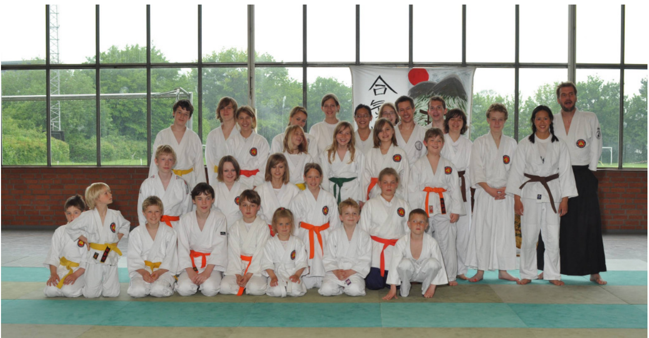
Die aktiven Teilnehmer am Jugendlehrgang in Grömitz

Es war das letzte Juni-Wochenende. Super schönes, warmes Wetter und klar: Ich bin in der Halle! – Wie sollte es auch anders sein!